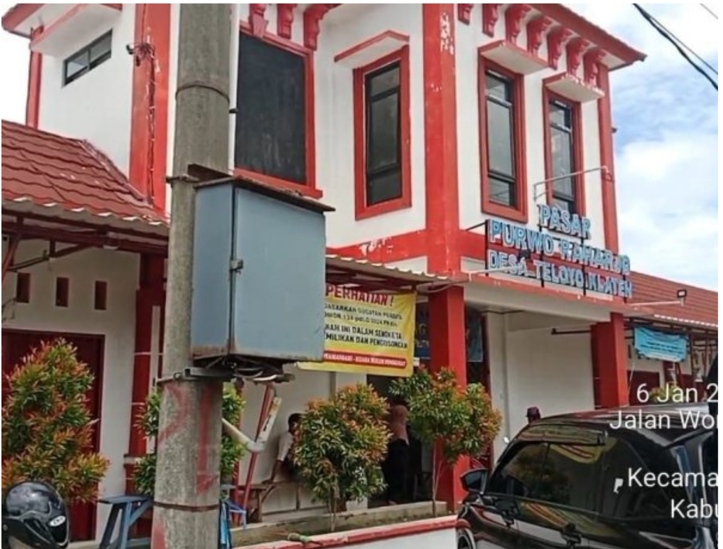
Foto: Pasar Purwo Raharjo di Desa Teloyo, Kecamatan Wonosari, Kabupaten Klaten, kembali memicu perhatian publik.

KLATEN - Polemik sengketa tanah Pasar Purwo Raharjo di Desa Teloyo, Kecamatan Wonosari, Kabupaten Klaten, kembali memicu perhatian publik.